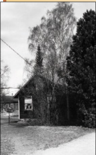
På foton från 1900-talets början ligger feldtska stugan i ensam majestät vid det som småningom skulle bli Centralgatan. Den här vyn öppnade sig för flanören nerför gatan vid tiden för den stora diskussionen våren 1978 om meningsfullheten i att bevara sin historia.

En dag i januari 2009 lyftes kiosken vid Centralgatan på ett lastbilsflak och kördes bort. Nu syns den bättre, den bastanta stenfoten bakom kiosken, stenfoten till Feldts stuga från förra sekelskiftet, vid rivningen för trettio år sedan den äldsta byggnaden i hjärtat av Karis stationssamhälle. Näst järnvägsstationen. Enligt den aktuella kvartersplanen skall tomten nu bli öppen plats eller torg. Av det gamla trädbeståndet reser sig en ensam kraftig björk och spridda barrträd.